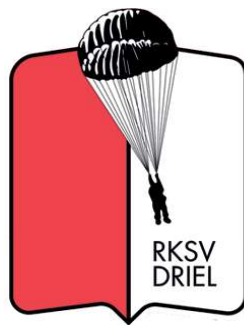
^ Logo RKSVDriel, uitgevoerd in rood en wit met parachutist

De al eerder genoemde pastoor Poelman speelde een belangrijke rol bij de oprichting op 19 oktober 1945 van de RKSVDriel als zelfstandige sportclub. De voetbalvereniging koos, als eerbetoon aan de Poolse veteranen, voor een tenue met de kleuren van de Poolse vlag: wit en rood. In 1985, bij gelegenheid van haar 40-jarig bestaan, werd een logo toegevoegd, voorstellend een soldaat aan zijn parachute tijdens een sprong; een verwijzing naar de Poolse parachutisten.