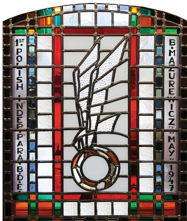
Stained-glass window >