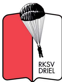
^ Logo RKSVDriel, executed in red and white with parachutist