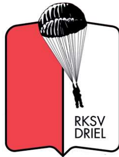
Logo RKSVDriel w kolorach czerwonym i białym ze spadochroniarzem